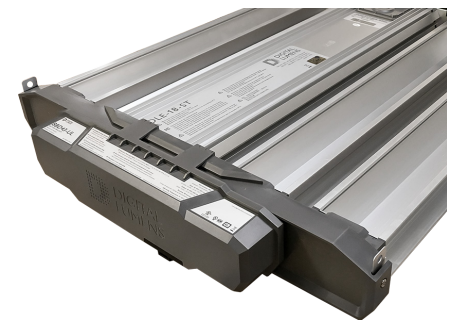
Batería de reserva en luminaria DLE

Si no se cumple con la totalidad o parte de estos requisitos, se pueden aplicar multas de hasta $70.000 por infracción y, en el caso de la muerte de un empleado, estas pueden ascender a $500.000 y/o pena de cárcel para el empleador que resulte responsable.